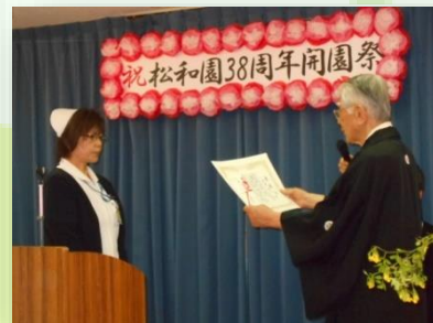
職員永年勤続表彰