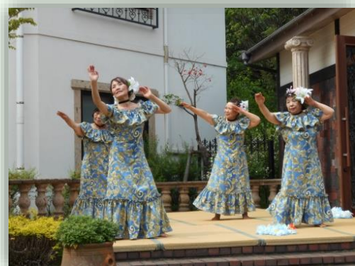
ハッピーフラダンス様