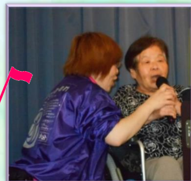
日ごろ練習していた曲を披露していただきました