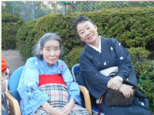
ご家族の方も着物姿で参加していただきました。