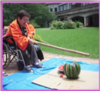
すいか割り！ がんばりました！！