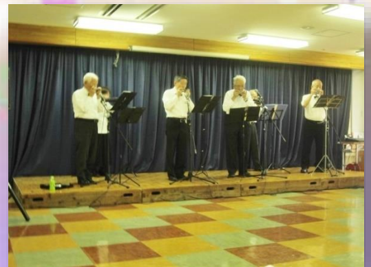
ハーモニカクラブ こだま様 ハーモニカ演奏