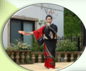
美貴の会様 日本舞踊