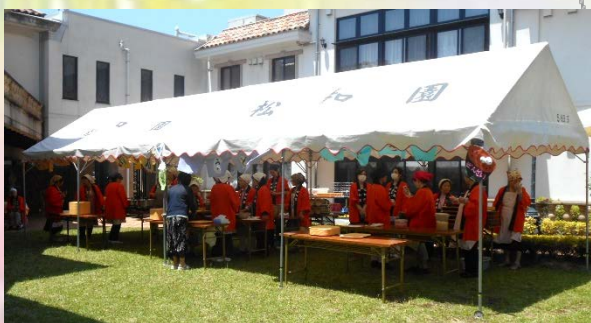
ボランティアの皆さんによる模擬店也大盛況!