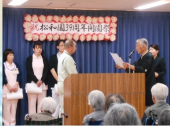
職員永年勤続表彰