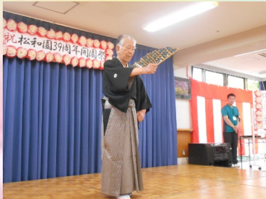
理事長による仕舞「養老」